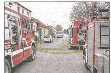
Sechs Feuerwehren aus der Umgebung waren vor Ort.