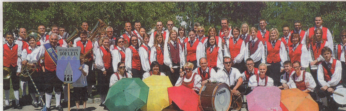
Der Musikverein ist fest in der Gemeinde Höflein verwurzelt und wirkt bei zahlreichen Veranstaltungen im Ort tatkräftig mit.

1997 Musikfest mit Höfleintreffen anlässlich 20 Jahre Musikverein Höflein und 90 Jahre Blasmusik in Höflein; jährliche Tage der Blasmusik, 30-jähriges Jubiläum, Mitwirken an zahlreichen ortsinternen Veranstaltungen, Gastauftritte