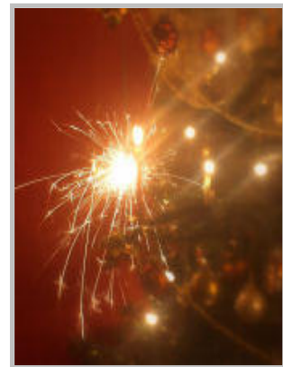
Sternspritzer sind oft die Ursache eines Brandes!