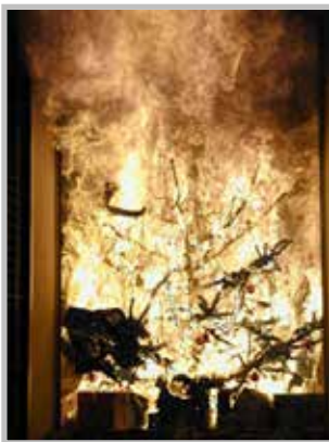
Christbaumbrand bereits nach wenigen Sekunden!