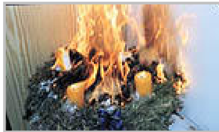
Lassen sie Adventkränze mit angezündeten Kerzen niemals unbeaufsichtigt!