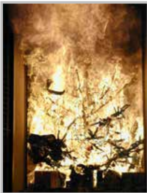
Christbaumbrand bereits nach wenigen Sekunden!